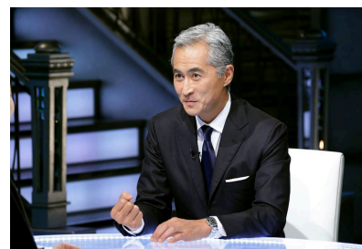
2014年「カンブリア宮殿」

1975年の「料理天国」に始まり、様々な料理番組やテレビドラマ・映画の撮影、料理関連取材に辻調グループは協力しています。メディアに出演したり料理監修を行うことは教員の研鑽にもつながり、その経験は学校授業や料理の技術・知識の発信に活かされています。