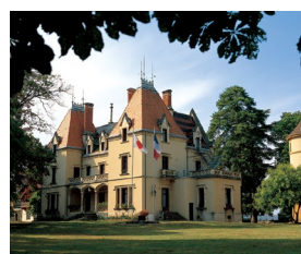
辻調グループフランス校